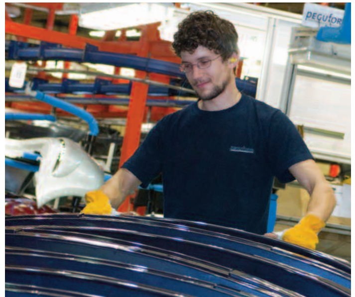
El PESA ha fijado como objetivo la mejora permanente en calidad y costes.

entre todas las empresas del sector, se fijarán mecanismos que doten a la industria de capacidad para adaptarse a los cambios del entorno y se seguirá apostando por la innovación tecnológica y por el desarrollo del tejido industrial gallego. Todo ello será compatible con el desarrollo integral de las personas que trabajamos en automoción y con el compromiso de nuestra industria con el desarrollo económico y social de Galicia.