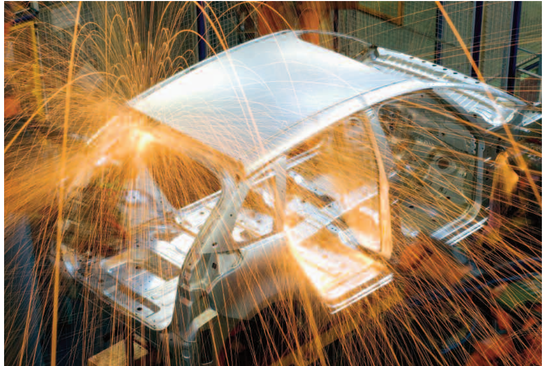
La Fundación CEAGA agrupa a todas las empresas del sector, incluido el Centro de Vigo de PSA Peugeot Citroën.

En 1997, 37 empresas gallegas de componentes de automoción unieron sus fuerzas para crear CEAGA. Diez años después, con 75 compañías y el Centro de Vigo de PSA Peugeot Citroën, este cluster se ha convertido en referente de España y Europa. Ahora, la Fundación CEAGA completa el proyecto con la puesta en marcha del Plan Estratégico del Sector de Automoción de Galicia (PESA), que impulsará el sector en su búsqueda de la excelencia y la competitividad.