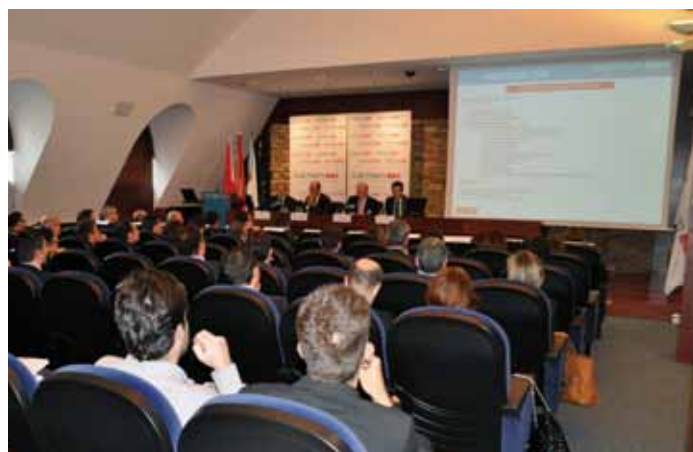
Asamblea anual de CEAGA celebrada el 30 de marzo de 2011