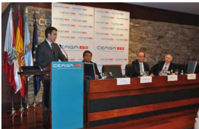
El Presidente de la Xunta de Galicia, Alberto Núñez Feijóo, durante su intervención en la Asamblea de CEAGA.