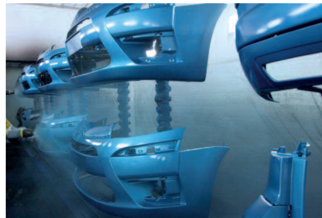
La crisis ha supuesto caídas de producción superiores al 30% en algunas empresas del sector.

Es precisamente ahora, en estos difíciles momentos, cuando el Plan Estratégico del Sector de Automoción (PESA) puesto en marcha en 2004, cobra su verdadera dimensión. De hecho, el PESA es uno de los principales referentes de las 10 Medidas que CEAGA activó el pasado mes de octubre para responder a la crisis. ■