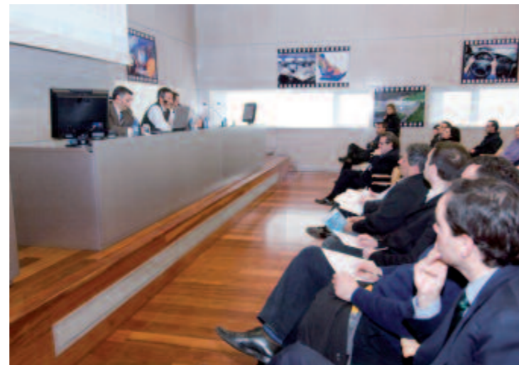
El sector se reúne periódicamente para analizar los efectos de la crisis y buscar soluciones.